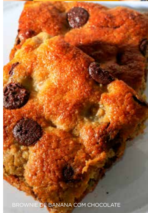
BROWNIE DE BANANA COM CHOCOLATE