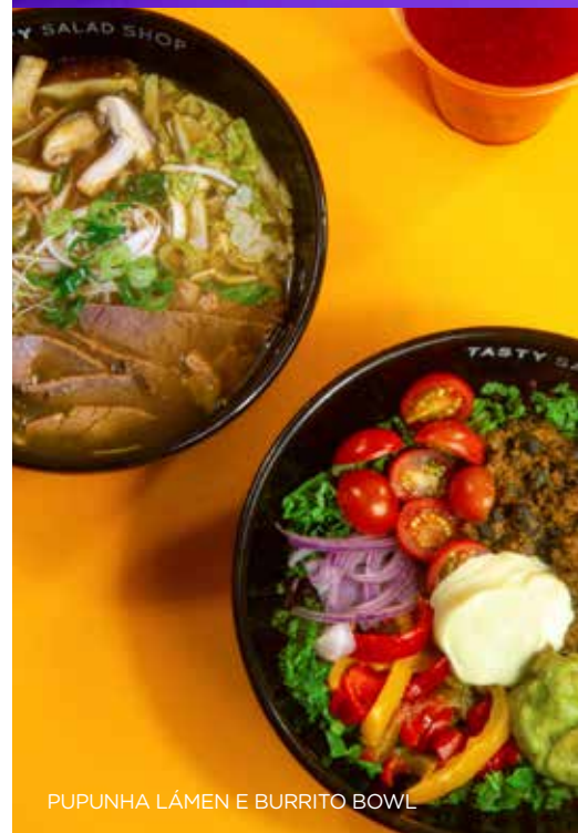
PUPUNHA LÁMEN E BURRITO BOWL