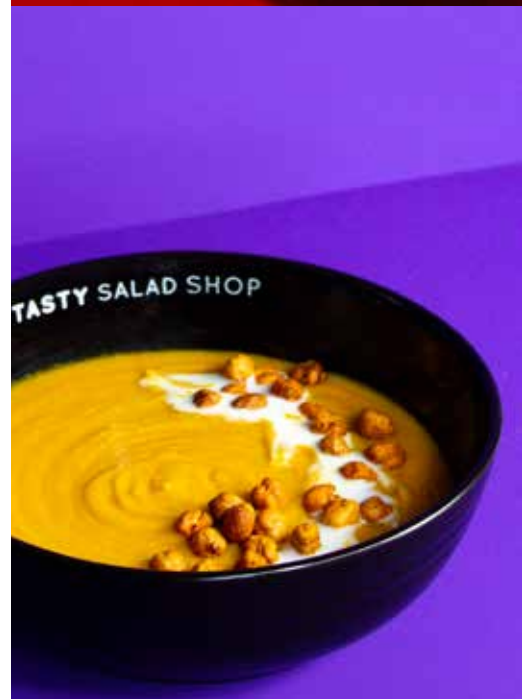
PUMPKIN THAI SOUP