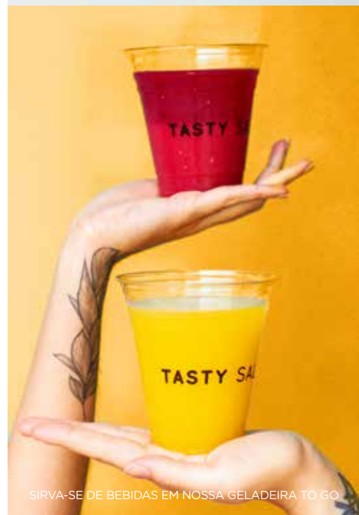
SIRVA-SE DE BEBIDAS EM NOSSA GELADEIRA TO GO